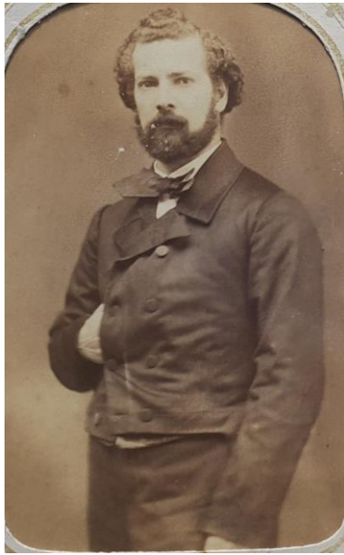
José María Samper Agudelo