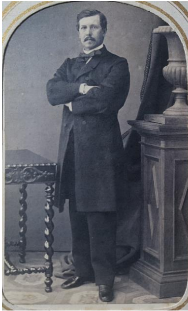
Manuel Samper Agudelo

Manuel Samper Agudelo. Nació en Honda (1823) y murió en Villeta (1900) estudió jurisprudencia en el Colegio Mayor de Nuestra Señora del Rosario, fue Comerciante, fundó una Tabacalera en Ambalema, y posteriormente Los Almacenes El Gallo con agentes en todo el país, además en Manchester, Barcelona y París.