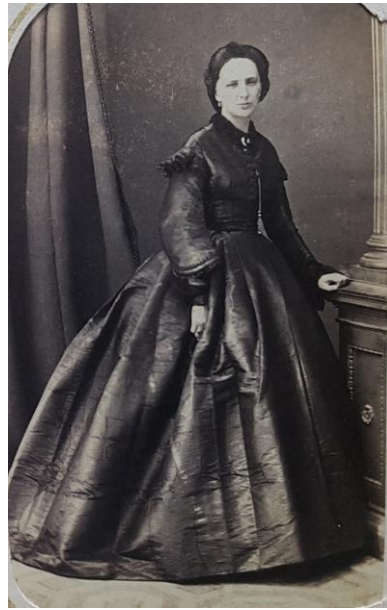
Soledad Acosta de Samper