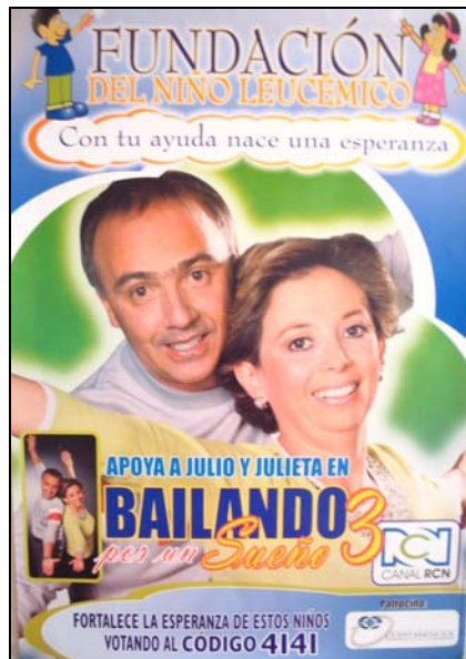
Afiche promocional del “Reality Bailando por un Sueño” (2006) de RCN Televisión.